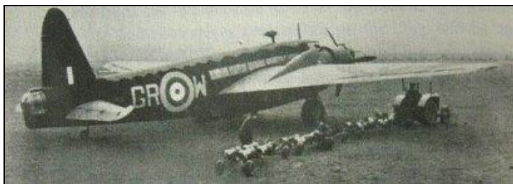
Andrzej Kleeberg był strzelcem pokładowym Dywizjonu 301 na bombowcach typu "Wellington".

Australian International Research Institute Inc.