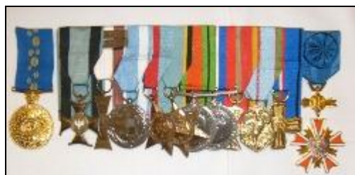
Polskie, Angielskie i Francuskie medale wojskowe.