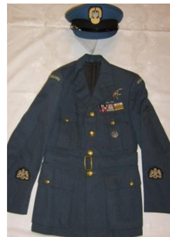
Mundur Królewskiego Korpusu Lotniczego z polskimi naszywkami naramiennymi "Poland".